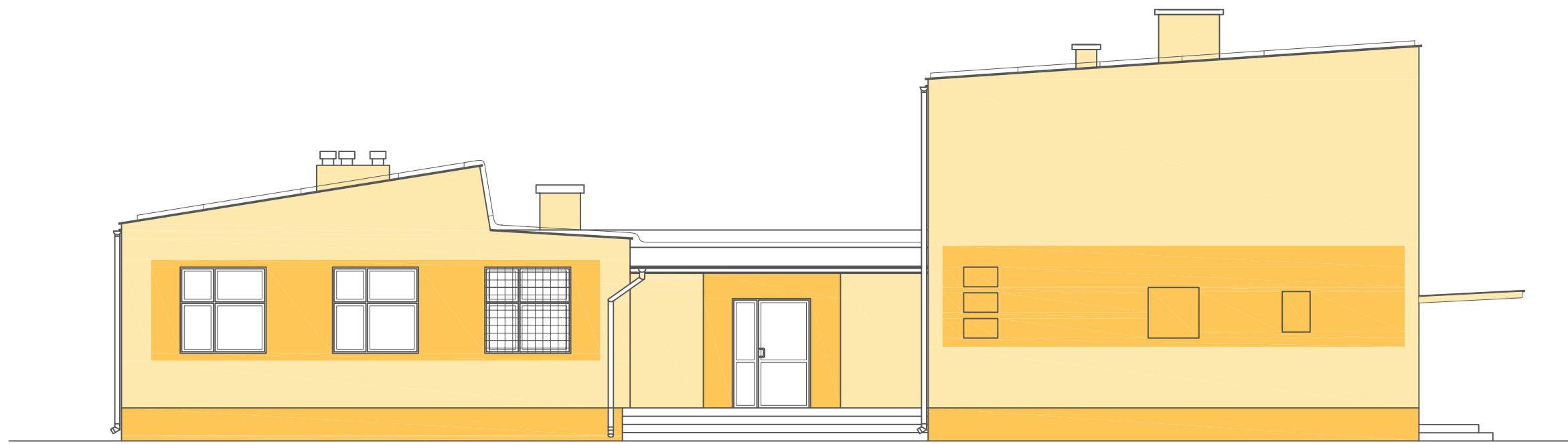
ELEWACJA POŁUDNIOWA - 4