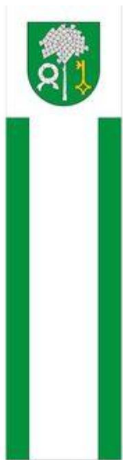
Baner gminy Głowaczów .