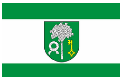
Flaga gminy Głowaczów

Herb gminy Głowaczów przedstawia w zielonym polu tarczy herbowej brzozę srebrną, na prawo od niej srebrna nałęczka, na lewo złoty klucz w słup piórem w prawo. Brzoza w herbie odnosi się do miejscowości Brzózka, nałęczka pochodzi z herbu Nałęcz rod. Leżeńskich a klucz z herbu Jasieńczyk rod. Boskich - dawnych dziedziców Głowaczowa.